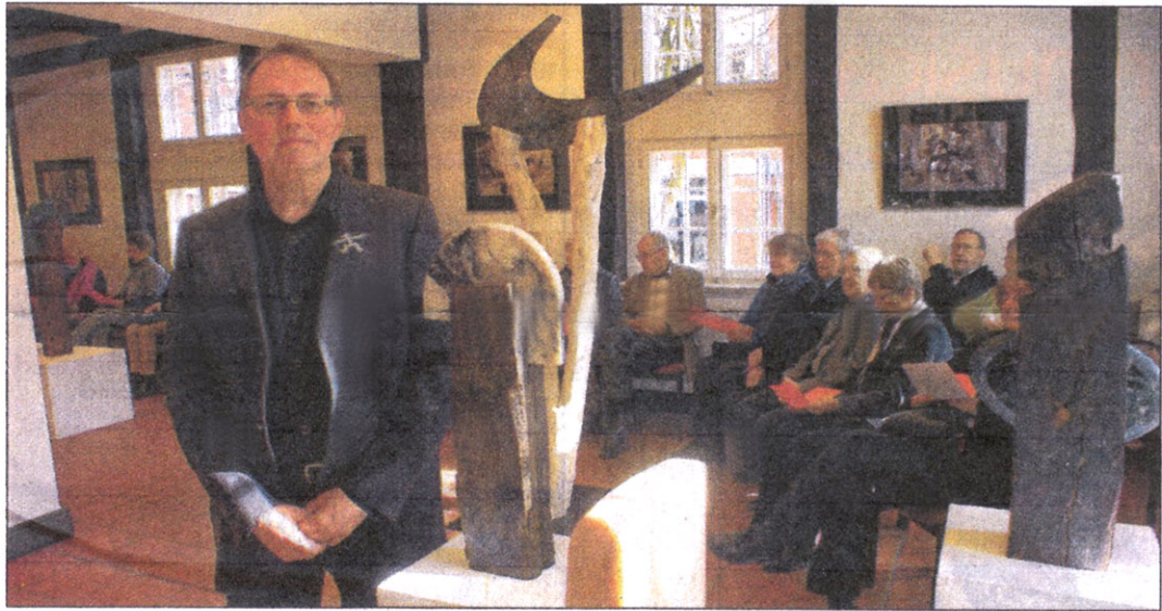
Künstler hansARTig zwischen seinen Skulpturen der „Zwischenmenschlichkeit“.